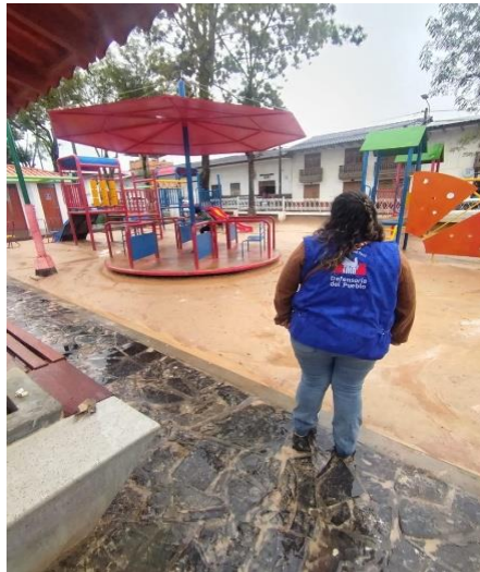
Figura n.º 03 Afectación del Hospital II-E del distrito de Banda de Shilcayo